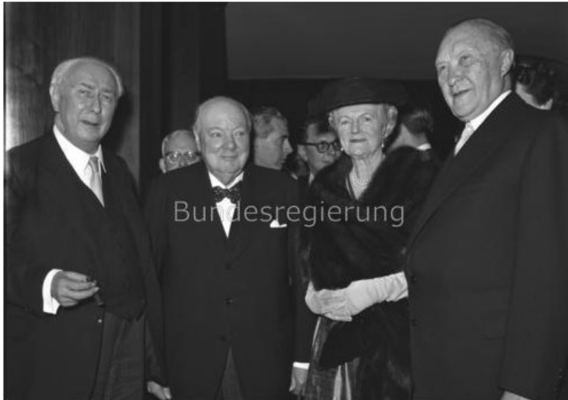
Bundesregierung, B 145 Bild-00005034 Foto: Unterberg, Rolf | 10. Mai 1956